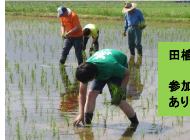
田植え 初体験！ 参加者中 田植え体験 ありは1名でした。

ヒューマングループは5S活動に力を入れています。チームに分かれて美しさや断捨離を競います。